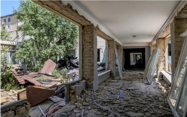
28-ე ბაგა-ბაღის შენობის დემონტაჟი