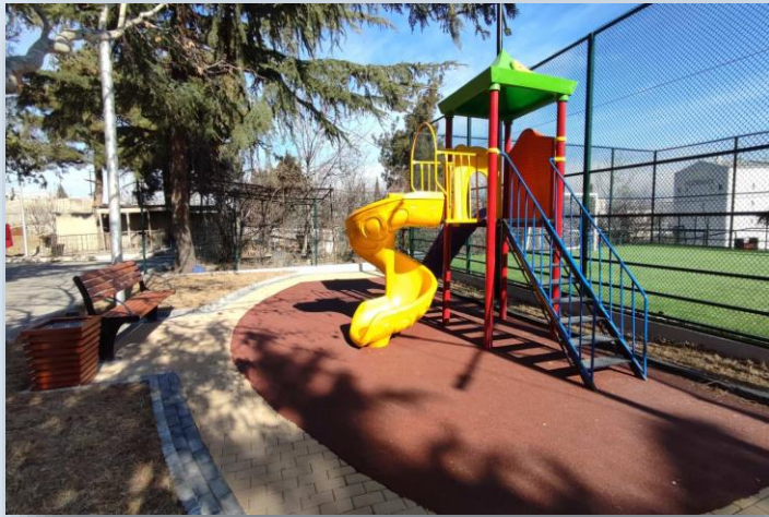
მოეწყო ახალი რეკრეაციული სივრცე